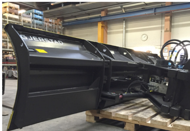
Gjerstads produktprogram dækker ikke blot læsse- og graveskovle, men også bl.a. sneblade, som fremstilles hos Sjørring.